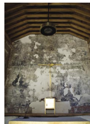
6. Pintura mural. Na parede oriental da cabeceira é ainda visível um programa de pintura mural, composto à maneira de um retábulo, onde são identificáveis as representações de São Bento – à esquerda do observador – e de São Bernardo (?) – à direita do observador. Encimando a composição, destaca-se o brasão dos Melos.

Ao contrário do que acontecia na Época Românica, na Época Gótica o momento crucial da missa consistia na elevação da hóstia, constituindo o instante mais apreciado do desenrolar do ritual litúrgico. Esta devoção da Eucaristia aumentou largamente durante a Baixa Idade Média. O seu culto suscitou grande número de milagres destinados a provar a presença real de Cristo na hóstia. Perante a dúvida de um sacerdote acerca da transmutação, ou da acção de um judeu sacrílego, o sangue de Cristo brotava da hóstia convencendo os incrédulos da verdade do Santo Sacramento . É depois da Contra-Reforma que a encenação litúrgica e iconográfica do triunfo da Eucaristia atinge o seu auge, mas a sua manifestação é muito anterior, como demonstra a iconografia do século XV e dos inícios do século XVI.