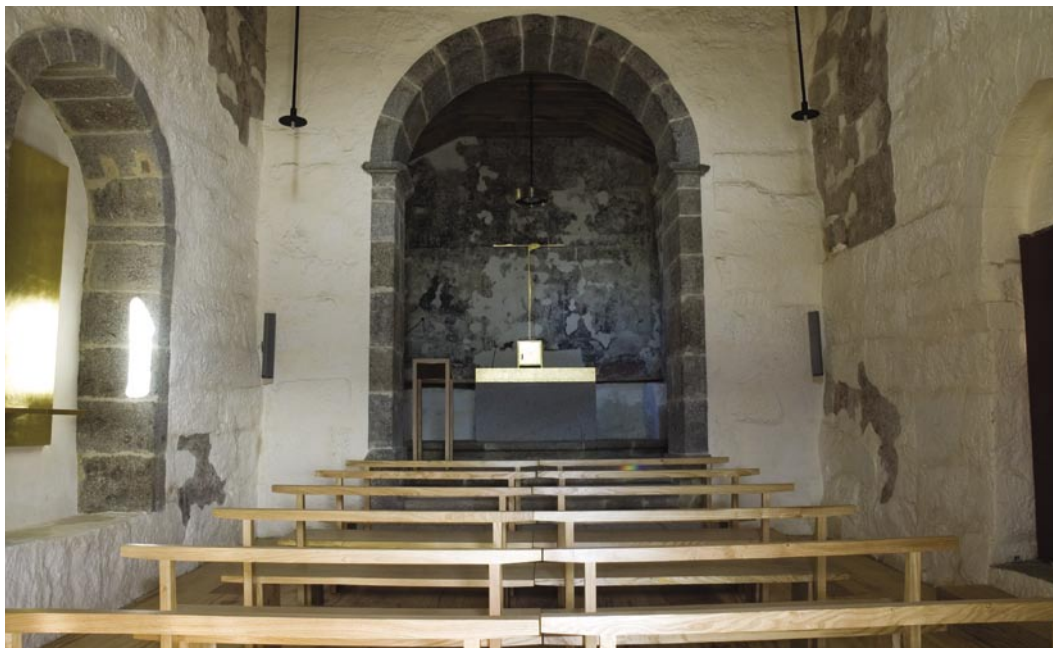
5. O arco □ contemporânea são exemplos de quanto o espaço de uma igreja é um elemento em constante mutação.

Segundo a norma habitual na conservação das igrejas e respectivo recheio, cabia ou aos párocos, ou aos comendatários zelar pela cabeceira, sacristia e casa do pároco. Na capela-mor, cumpria-lhes fazer obras, ornamentar e prover de alfaias litúrgicas. Os fregueses, isto é, os habitantes da freguesia, estavam obrigados à manutenção, reforma e reconstrução da nave e a cuidar e renovar todo o seu recheio como os altares de fora e os ornamentos e objectos de devoção.