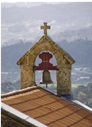
4. Na Época Românica, uma igreja com o seu campanário era uma garantia de segurança física e psíquica para os habitantes de uma paróquia.

Estes elementos construtivos e decorativos fazem da Igreja de São Mamede um excelente exemplar do sabor regional e periférico que a arquitectura românica portuguesa, ao prolongar-se muito no tempo, demonstra em vários edifícios religiosos. É também testemunha de como o estilo românico, cujos modelos chegaram de França entre os finais do século XI e os inícios do século XII, se adaptou às tradições e circunstâncias locais. A longa permanência deste modo de construir, que chega até ao século XIV e por vezes até ao século XVI, conduz a que classifiquemos este tipo de igreja de românico de resistência .