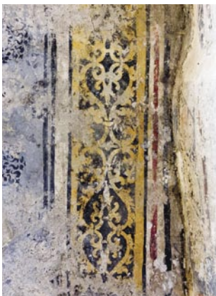
11. Pintura mural. Moldura. O motivo decorativo desta moldura é semelhante a um dos motivos utilizados no Mosteiro de Santa Maria de Pombeiro.

É evidente a escassez de referenciais artísticos dos séculos XVII e XVIII, um aspecto que se pode explicar pelo facto de este edifício ter passado por um longo período de abandono, que o conduziu a um profundo estado de ruína. A partir de meados do século XIX, o seu culto foi transferido para a Igreja Nova de Vila Verde, templo construído de raiz com maiores dimensões e uma situação mais favorável ao acesso das populações.