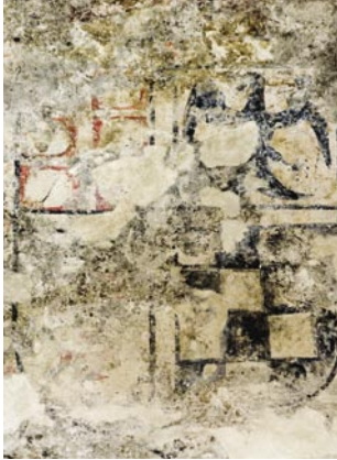
10. Pintura mural. Parede oriental da cabeceira. Brasão dos Melos, abades comendatários do Mosteiro de Santa Maria de Pombeiro (Felgueiras). A Igreja de São Mamede de Vila Verde era do padroado do referido Mosteiro. As duas campanhas de pintura mural da Igreja de São Mamede, uma da 1ª década e outra dos meados do séc. XVI, resultaram de encomendas daqueles abades.