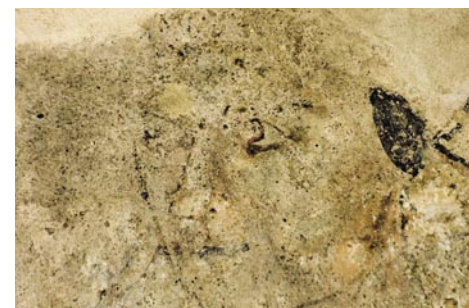
12. Pintura mural. Parede oriental da cabeceira. Representação de São Bernardo (?).

A nova igreja, datada de 1866, apresenta uma arquitectura marcada pela simplicidade, rigor construtivo e sobriedade, características do período de Oitocentos. Mais assinalável, no entanto, é o seu património