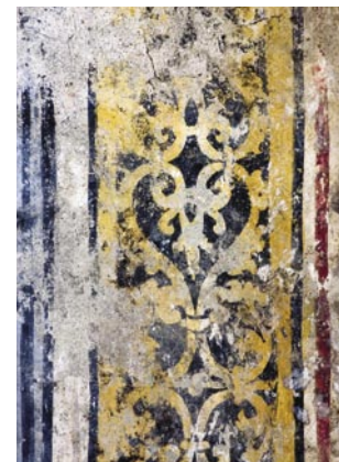
8. Pintura mural. Moldura decorativa.