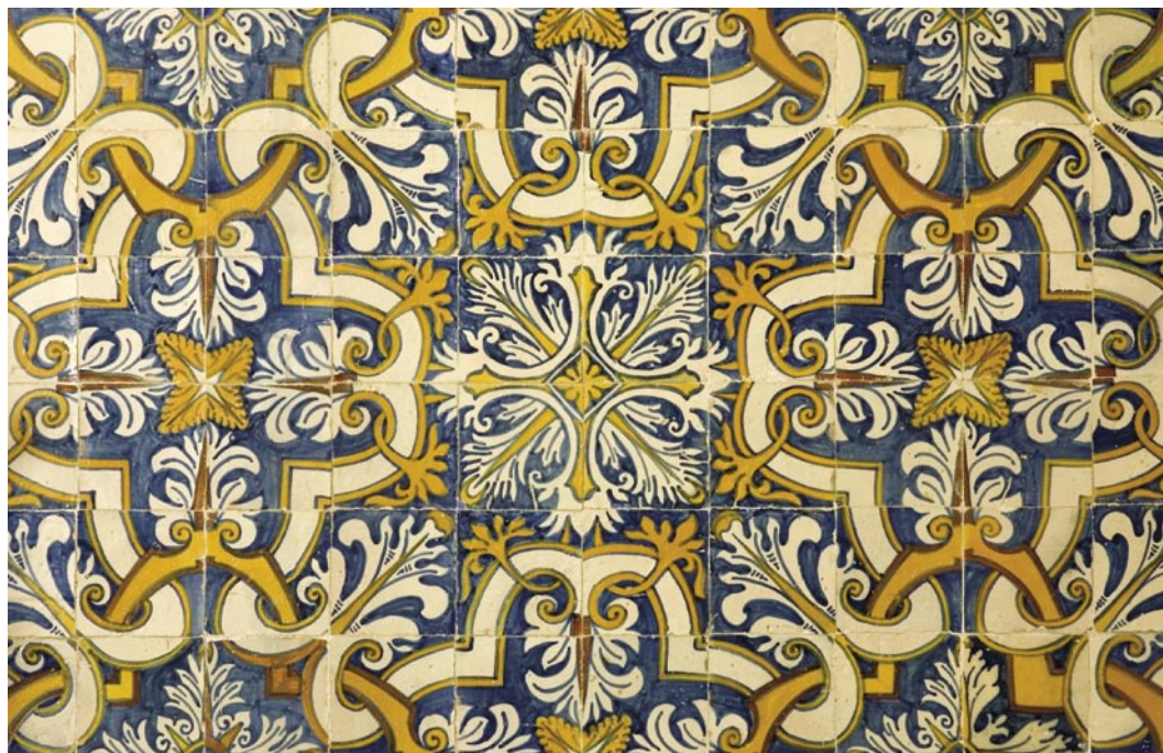
15. Painel de azulejos da capela-mor. Séc. XVII.