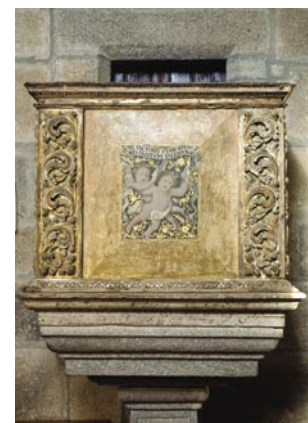
14. Púlpito. Início do séc. XVII.

«QUI VOS AUDIT ME /AUDIT./ LU C.10», no painel frontal «ESTOTE FACTORES VERBI & NON AUDI/TORES TANTUM FALENTEVOS/ MET/ IPSOS.» e, finalmente, no painel lateral à direita «NON ENIM AUDITORES SED FAC/TORES LEGIS EUSTIFICAB/UNTUR./AC ROM.3.13».