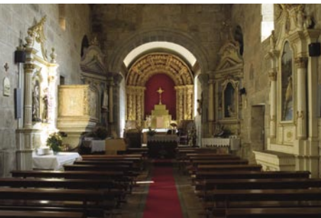
4. A matriz de Unhão conserva a nave da construção românica.

A mesa do altar era então ungida em cinco pontos e as paredes internas eram espargidas com Água Benta. Seguia-se o momento crucial da deposição das relíquias, no pé-de-altar, precedida de procissão solene. O loculus , espaço reservado às relíquias, era ungido e benzido, sendo aí colocada uma argamassa sobre a qual assentavam as relíquias. Depois de encerrado e sagrado o loculus do altar, o Bispo procedia à unção das doze cruzes da Sagração, gravadas nas paredes da igreja, regressando de novo ao altar onde colocava cinco grãos de incenso e cinco velas. Posteriormente à incensação de todo o espaço, era rezada uma missa solene à qual podiam assistir os crentes 6 .