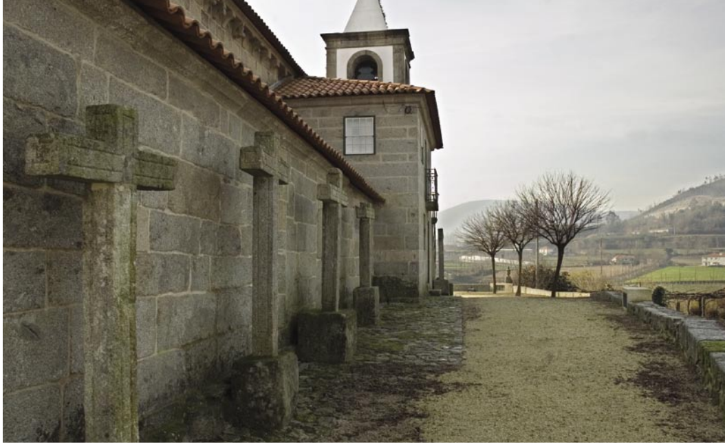
12. Fachada norte. A torre sineira, a sacristia e a Via Sacra correspondem a elementos da Época Moderna.

quial, marcava o compasso quotidiano: marcava o início da jornada, chamando para a missa; pelo fim da manhã o toque do meio-dia, anunciava a hora da refeição; ao fim da tarde, o toque das Ave-Marias, expressava aos camponeses dispersos na labuta rural que era hora de terminar a faina e regressar ao lar. Mas os sinos tanto tangiam pela vida, como dobravam pela morte. A cadência sonora e o ritmo imposto pelo tangedor, funcionava como um código que só a população rural sabia, e sabe ainda, interpretar. Dispersos pelos campos que formavam a área da freguesia, ao ouvir o som do sino que se impunha sobre os sons da natureza, o homem era informado dos acontecimentos que marcavam e timbravam a metamorfose do tempo, tanto do micro-espaco paroquial como do contexto nacional. Informava a freguesia da morte e do nascimento, do casamento e do baptizado das figuras reinantes do país, como chamava também ao recolhimento e à oração individual; na inquietação e sobressalto da quietude paroquial tocava a rebate: som de guerra, som de incêndio, som de pilhagem, eram informações transmitidas pelo sino à colectividade comunal. E assim, o som do sino era um veículo de unidade vicinal. Quanto mais alta fosse a torre sineira, mais longe chegava a notícia que o sino transmitia.