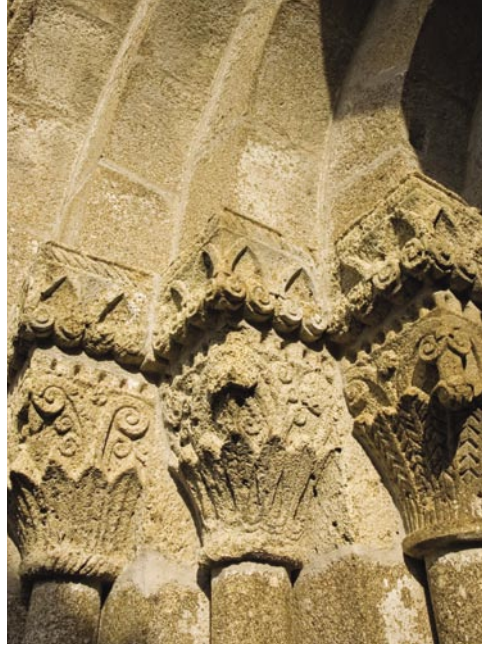
10. Portal ocidental. Capitéis.

Na igreja românica a escultura concentra-se, exteriormente, nos portais, nas aberturas de iluminação, com especial relevo para a fresta ou frestas da cabeceira, nos cachorros que, por norma, sustentam as cornijas e nos capitéis e bases de colunas adossadas. No interior é igualmente nos capitéis, com especial relevo para os capitéis do arco triunfal, que ela se concentra, mas também nas bases, que no românico português tendem a receber escultura vegetalista, geométrica e também figurativa.