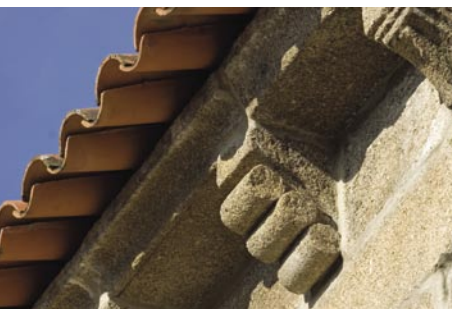
5. Fachada sul. Cachorros.

A fachada principal, orientada a Oeste, é rematada superiormente por um arranjo setecentista, mas mantém o portal e a fresta da Época Românica.