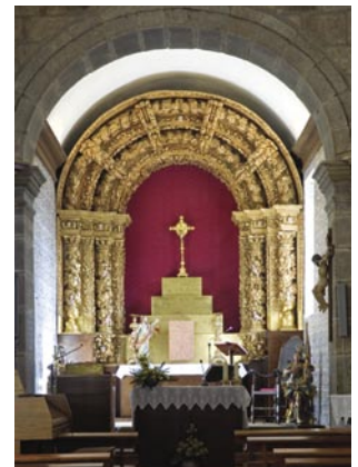
13. A cabeceira foi construída de novo no âmbito da reforma do final do séc. XVII e do início do séc. XVIII.

Para além da estrutura quadrangular da torre sineira da Igreja de Unhão, no exterior detecta-se ainda o acrescento de outros elementos arquitectónicos datados dos séculos XVII e XVIII. Por exemplo, na fachada principal foram adicionadas, em jeito de remate do ângulo axial da empena, duas pirâmides bulbiformes que enquadram uma cruz colocada sobre uma base decorada com duas volutas. Dessa