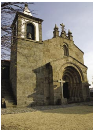
1. Apesar das transformações que foi recebendo, ocidentalmente na torre e na cabeceira, a igreja do Salvador de Unhão é um excelente testemunho da arquitectura românica portuguesa.

É uma inscrição comemorativa da Dedicção da Igreja que, segundo Mário Barroca, foi gravada já depois da parede sul estar erguida o que permite datar, ou essa fase da construção, ou a conclusão do templo 3 . A Igreja foi dedicada por D. João Peculiar, que ocupou o cargo de Arcebispo de Braga entre 1138 e 1175.