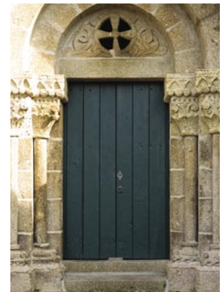
11. Portal ocidental. No tímpano, a cruz vazada e envolvida por entrelaços, corresponde a um tema comum no românico português.

Entre estes temas devemos situar a cruz vazada protegida por um círculo e rodeada por laçaria, presente no tímpano do portal principal do Salvador de Unhão. A escolha de temas como este e o seu uso algo sistemático são indícios do seu poder significativo e da própria concepção dos portais dos templos, na Época Românica. Uma epígrafe do portal de São Pedro das Águias (Tabuaço) roga «ao Deus dos Exércitos que defenda a entrada e a saída deste templo».