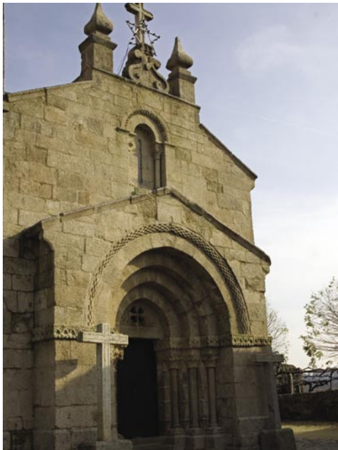
6. Fachada ocidental. O portal, inserido em estrutura p treia, tem um al ado semelhante aos portais das Igrejas de S o Vicente de Sousa e de Santa Maria de Air es, tamb m do concelho de Felgueiras.