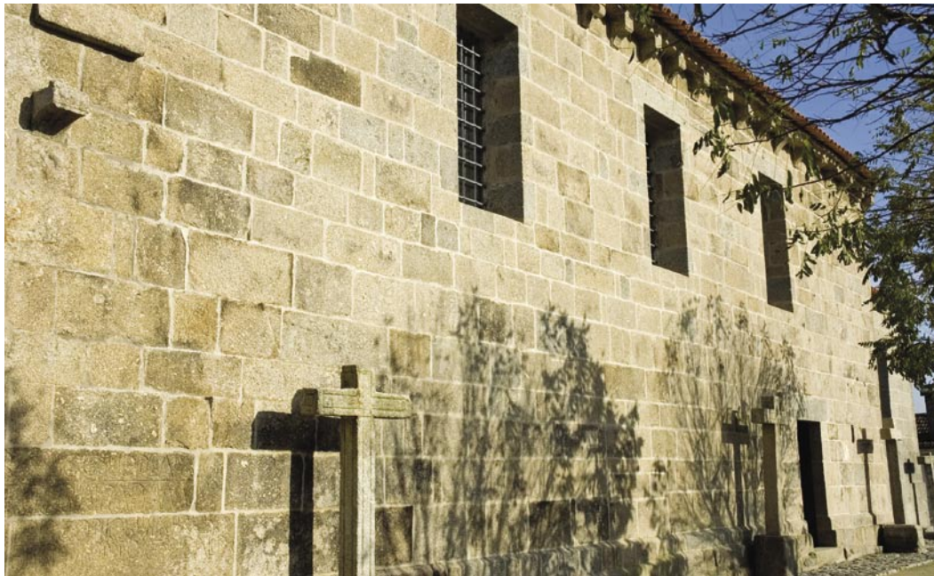
2. Fachada □

Igreja. Esta inscrição refere o Magister Sisaldis , provavelmente o mestre da obra.