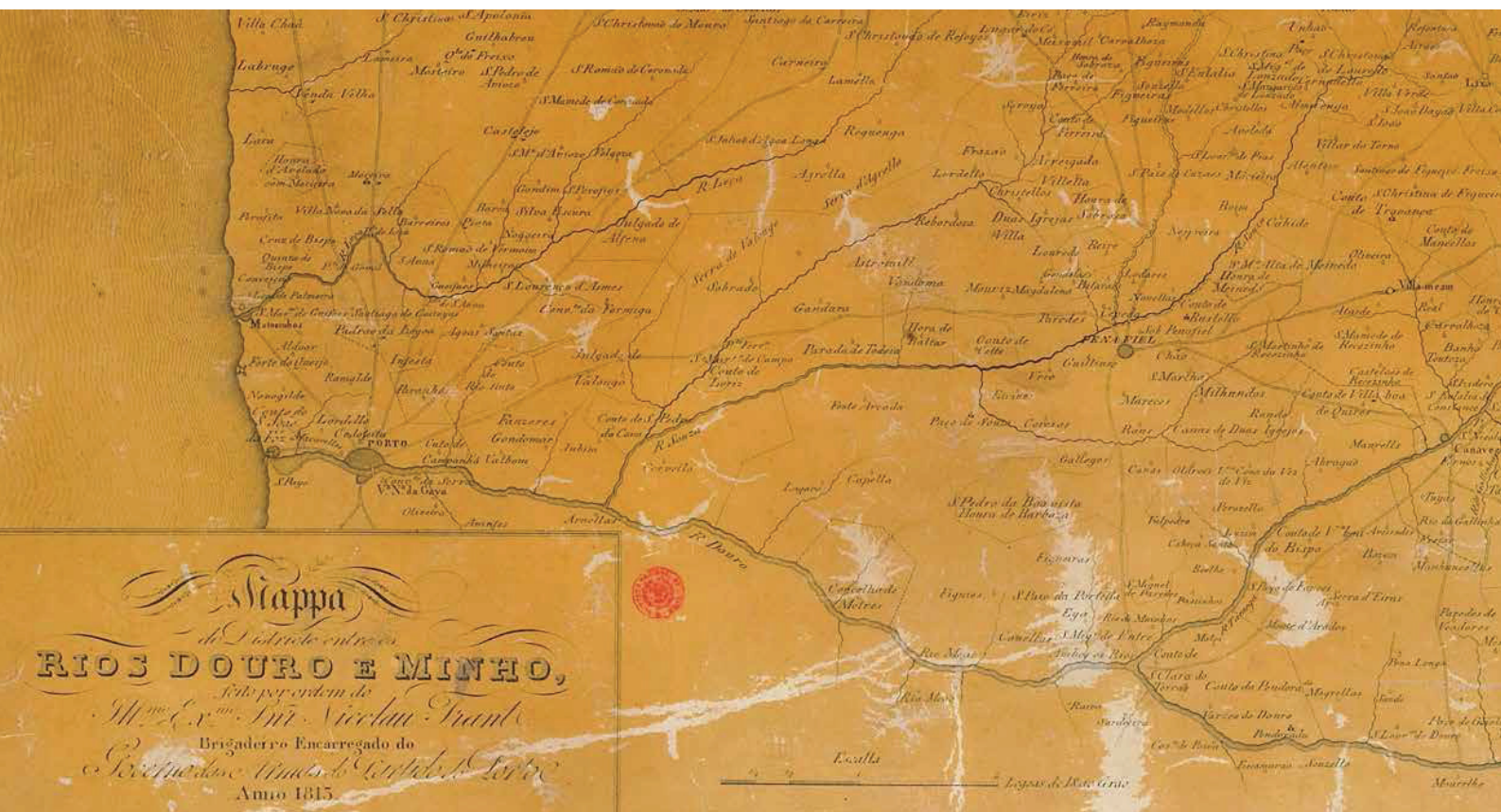
Mapa das principais vias de comunicação a partir do Porto (adaptado de Depósito dos Trabalhos Geodésicos, 1861).

Uma delas saía de Canaveses, logo a seguir à velha e grandiosa ponte medieval, quase em linha reta até em frente ao cais de Mourilhe (em Cinfães, desaparecido aquando da construção da barragem de Carrapatelo). Passava pelas povoações de Rio de Galinhas, Paredes de Viadores e Paços de Gaiolo, todas do Marco de Canaveses. De um conjunto de mapas antigos do território português apenas dois, um de 1720 2 e um de 1797 3 , assinalam uma via paralela ao Douro (na margem norte) ligando Mesão Frio a Entre-os-Rios. Provavelmente passaria em Ancede, através do couto ou próximo dele, mas dada a escala do mapa é impossível garantir que a estrada passasse sobre o rio Ovil, em Esmoriz. De resto, os afluentes do Douro constituíam canais de circulação já aproveitados no período da romanização. É assim mais fácil aceitar na região de Baião, vias estruturantes no sentido norte-sul, do que marginais ao Douro, ideia já partilhada, em 1985, por Mário Barroca 4 e, em 1991, por Arlindo de Magalhães e Maria Manuela Alves, que tentaram traçar os caminhos de peregrinação jacobea na área do concelho de Baião (Magalhães e Alves, 1991: 53-61).