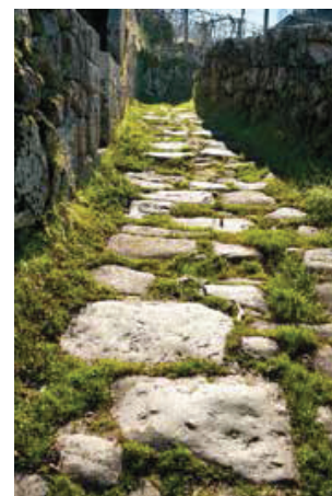
Calçada de acesso à Ponte.

Aliás, regressando à questão da importância da travessia, esta não pode ser analisada do ponto de vista contemporâneo. Deve sempre procurar buscar a utilidade da passagem no trajeto histórico das comunidades que dela se servem, já que as vias medievais e modernas (ao contrário das romanas) sempre tiveram um carácter local e regional só ultrapassado na contemporaneidade. A ponte deve, então, ser enquadrada num âmbito mais vasto de humanização e de circulação. Neste caso concreto, devemos olhar com atenção para o vale do rio ou ribeiro de Ovil que nasce próximo a Loivos do Monte (Baião) e desagua no rio Douro, junto à Pala. O seu sentido nordeste-sudeste obrigou a vários atravessamentos na direção do litoral para o interior. Sabendo que, na margem sul do Douro, existia uma via (ou, pelo menos, uma colagem de várias vias) ao longo da margem, podemos supor que, dada a ligação de Ancede ao Porto, sede episcopal e centro nevrálgico da economia, existisse também, na margem oposta, um percurso construído através da junção de vários ramais, e que pudesse conduzir àquela urbe por Alpendorada (Marco de Canaveses) e Entre-os-Rios (Penafiel). Porém, a cartografia antiga não assinala qualquer via importante seguindo este trajeto.