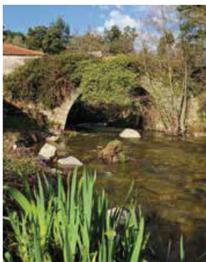
Vista de jusante.

Esta referência e a própria factualidade da Ponte de Esmoriz, de um só arco de volta perfeita, acusam a existência de uma travessia que devia ser importante, caso contrário não inspiraria o investimento, sendo perfeitamente assegurada por uma simples passagem de madeira, como nos outros três casos referidos pelo cura de Ancede. Contudo, se é certo que existia uma ponte de pedra em 1758, não podemos garantir, sem que os documentos ou a arqueologia o atestem, que a ponte referida naquele ano seja a passagem de hoje. Tal, deve-se, como no caso da Ponte da Panchorra (Resende), à utilização tardia de modelos construtivos cronologicamente remotos.