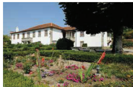
Casa de Esmoriz (Baião).