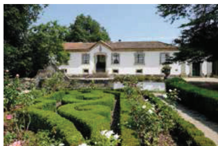
Casa de Penalva (Baião).