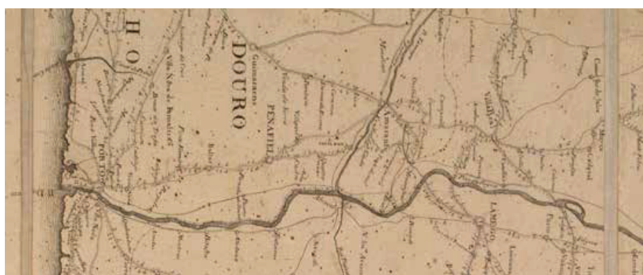
Carta militar das principais estradas de Portugal (adaptada de Eça, 1808).