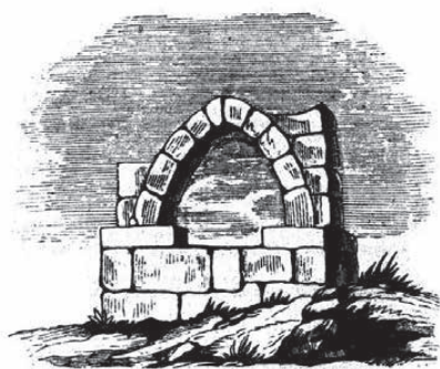
Reprodução de uma gravura do Memorial de Lordelo (Baião) (adaptado de Sotto Mayor, 1857).