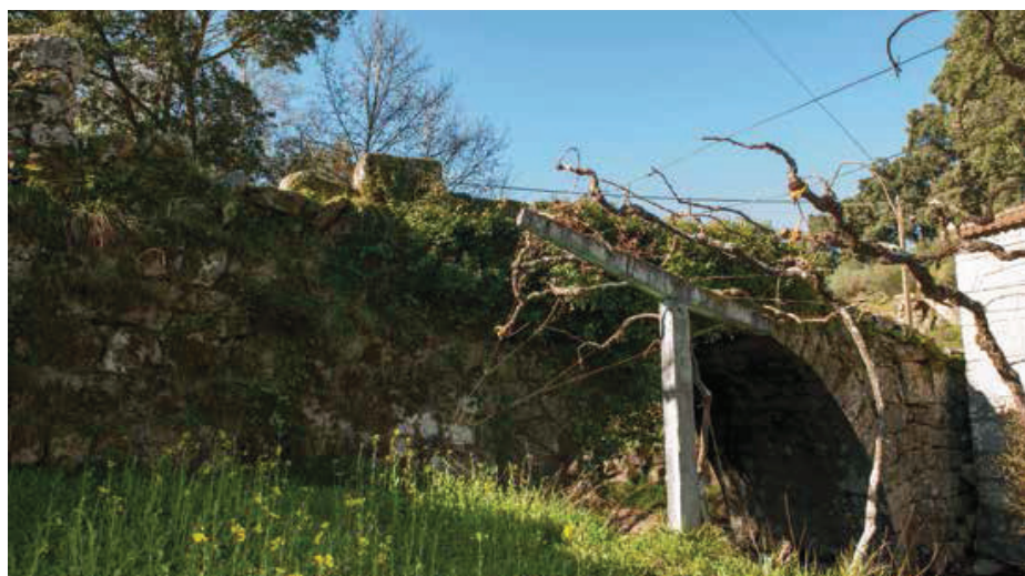
Vista de montante.