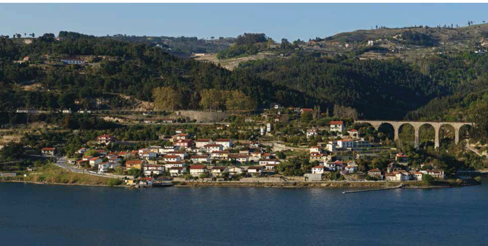
Vista do rio Douro junto à Pala e Porto Manso (Baião), que integravam o antigo couto de Ancede.

Por outro lado, podemos colocar uma hipótese: que esta travessia, enquadrada entre duas casas senhoriais (Esmoriz e Penalva) tenha sido edificada na esfera de vicinidade e da influência da nobreza local. Dada a sua localização, podemos até admitir a intervenção de algum dos seus senhores na construção e manutenção da Ponte e caminho, para acesso proveitoso e célere aos seus haveres.