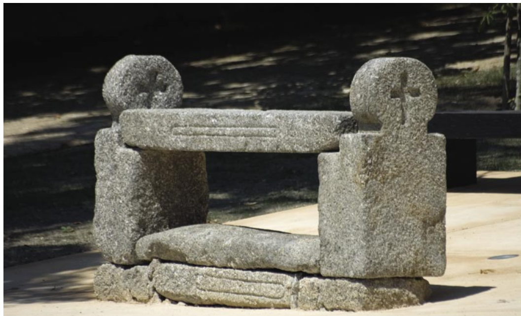
3. O Marmoiral de Sobrado ou Marmorial da Boavista, apresenta uma estrutura completamente distinta do Memorial da Ermida, uma vez que não apresenta arco.

A função deste tipo de monumentos, embora não esteja ainda totalmente esclarecida, deverá relacionar-se tanto com a colocação de túmulos como com a evocação da memória de alguém, como ainda com a passagem de cortejos fúnebres. Habitualmente situados em caminhos ou cruzamento de vias, consagram lugares de passagem que o homem sempre necessitou de simbolizar.