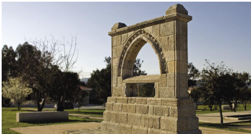
1. O Memorial da Ermida estava localizado junto à Estrada Velha Porto-Penafiel.

Este Marmoiral estava originalmente localizado junto à Estrada Velha que, saindo do Porto, atravessava a freguesia de Paço de Sousa, passava pela Ponte do Vau, seguindo depois para Nascente, já dentro