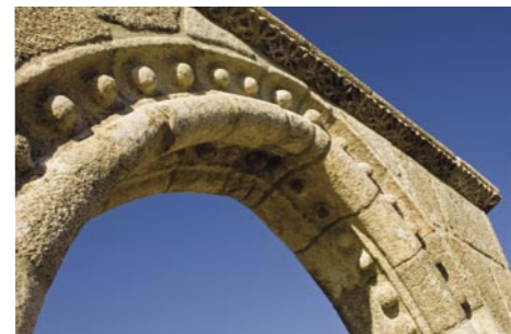
2. Memorial da Ermida. A decoração do arco segue os modelos próprios do Românico do Vale do Sousa.

Embora seja complexa a datação deste monumento, uma vez que a sua estrutura tem uma expressão diversa dos outros memoriais não permitindo comparações tipológicas, o Marmoiral de Sobrado tem sido datado de meados do século XIII.