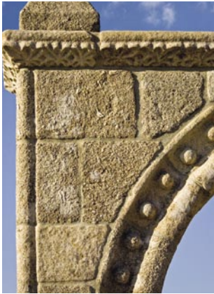
5. Memorial da Ermida. Detalhe do alçado.

Os Memoriais da Ermida e de Sobrado correspondem a monumentos que merecem ser valorizados, tanto pelo seu significado, como pela raridade de exemplares conservados em Portugal.