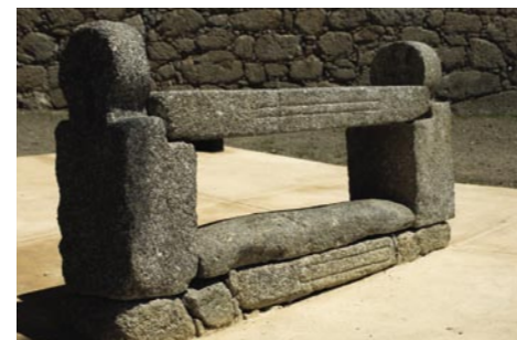
4. Marmoiral de Sobrado. Cabeceira vertical com cruz gravada.

No entanto refere que, conforme dizia a tradição, estes túmulos correspondiam a «homens que morreram em desafio» 21 .